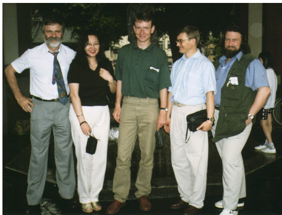
Japonia, 1998.06 – Konges CAR CAD CAS