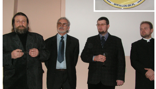
Otwarcie ŁOSia 2007

ministerialnej komisji do spraw procedur i audytów klinicznych w radiologii, aktywnie pracuje nad podniesieniem standardów i jakości usług radiologicznych w Polsce.