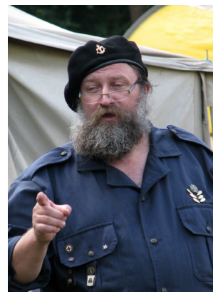
2008 Sudety, Złot Dinozaurów

Wciąż nowe, dające ogromne rozszerzenie możliwości, metody i sposoby obrazowania oraz interpretacji tych obrazów.