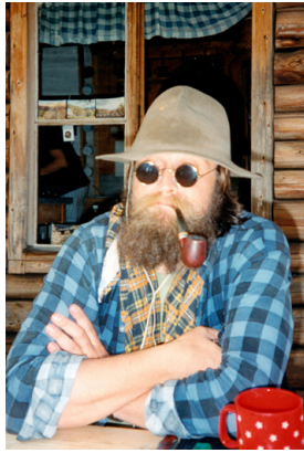
Bieszczady – podróż zaręczynowa Bieszczady. Obóz wędrowny

Jego zaangażowanie w harcerstwo zostało docenione 29 czerwca 2012 roku, gdy otrzymał Brązowy Krzyż za Zasługi dla ZHP. To wyróżnienie jest dowodem na jego wieloletnie oddanie idei harcerskiej i wpływ, jaki wywarł na rozwój młodzieży.