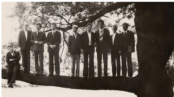
Po rozdaniu dyplomów; Politechnika Łódzka

Ta filozofia towarzyszyła mu, gdy 1 maja 1979 roku przekroczył progi Wojewódzkiego Szpitala Zespołowego im. M. Kopernika w Łodzi jako świeżo upieczony