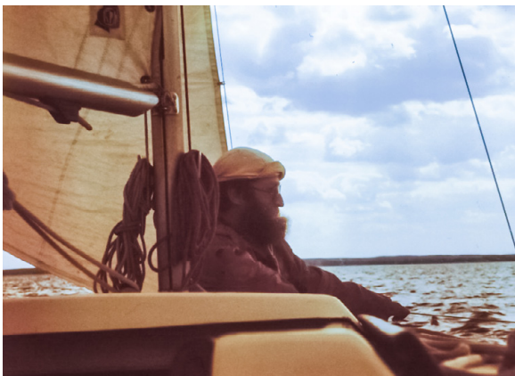
Rejs Śniardwy, 1986

„Na wodzie czy w górach, jak w życiu – mówi swoim podopiecznym – trzeba umieć dostosować się do zmiennych warunków i zawsze trzymać się obranego kursu”.